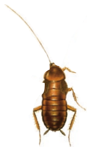
Orientalisk kackerlacka, 17-28 mm Blatta orientalis