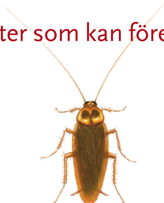
Amerikansk kackerlacka, 30-40 mm Periplaneta americana