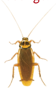
Australisk kackerlacka, 20-35 mm Periplaneta australasiae

De här arterna kommer regelbundet in i landet via importerade varor. Den amerikanska och den australiska kackerlackan är känsligare för temperaturvariationer än den tyska kackerlackan. De trivs bäst i mycket fuktiga och varma utrymmen och har långsam förökning.